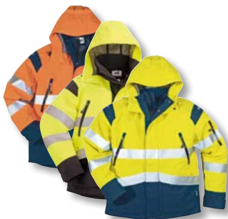
GXB-484, Seite 73

Alle nachstehenden Kleidungsstücke sind mit einer dauerhaft wasserdichten GORE-TEX® Membran ausgestattet. Die GORE-TEX® Membran bietet eine hervorragende Atmungsaktivität. Weitere Kleidungsstücke der R.A.W™ Kollektion finden Sie auf den Seiten 40 und 41, 72 und 73, 94, 116 und 117, 139 und 140 sowie 152 und 153. Dort finden Sie auch die nachstehend genannten Kleidungsstücke.