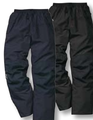
GX-217, Seite 117