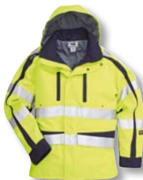
GXH-429, Seite 94