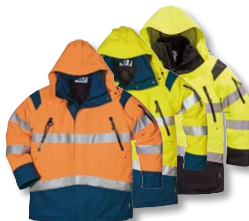
GXB-482, Seite 73