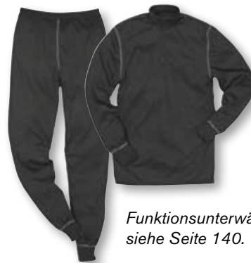
Funktionsunterwäsche, siehe Seite 140.