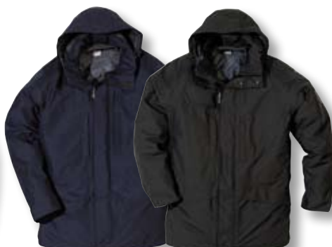
GX-408, Seite 117