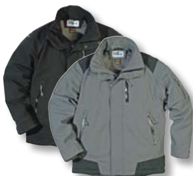
GXB-487, Seite 41