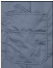
Beintasche mit verdeckter Zollstocktasche sowie drei zusätzlichen Taschen