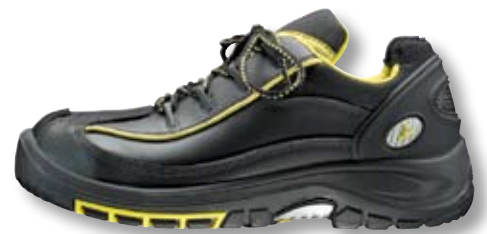
Schuhe, siehe Seite 18.