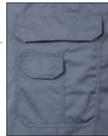
Beintasche mit Patte und Handytasche mit Patte