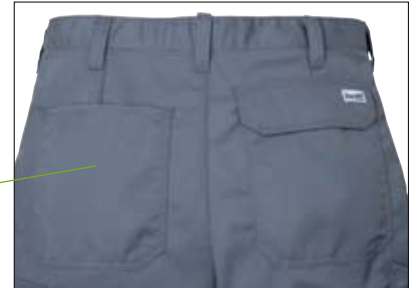
Zwei geräumige Gesäßtaschen - eine mit Patte