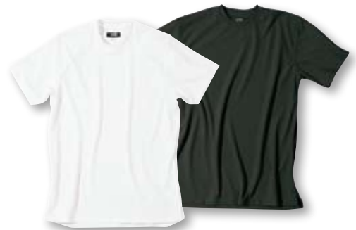
Atmungsaktive T-Shirts, siehe Seite 141.