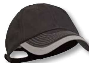
Mütze, siehe Seite 177.