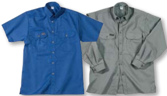
Hemden, siehe Seite 123.