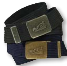
Gürtel, siehe Seiten 173 und 179